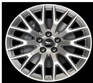
D2VB3 & D2GBU