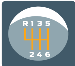
Prevodovka vyvinutá pre Focus ST