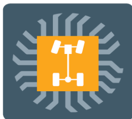
ESP nastaviteľné v troch režimoch