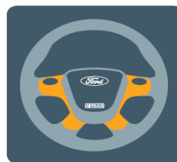
Riadenie s progresívnym účinkom