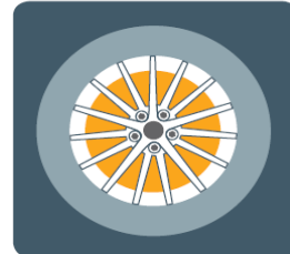
Až 19" disky kolies z ľahkej zliatiny