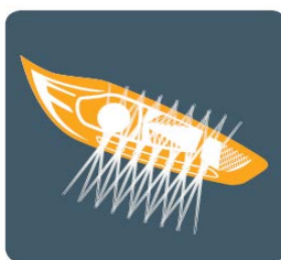
Nové adaptívne Bi-Xenónové svetlomety