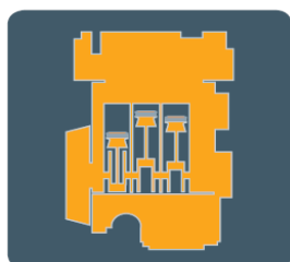
Diesellový motor TDCi 136kW / 185k