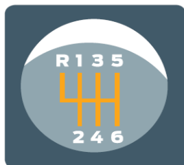
Prevodovka vyvinutá pre Focus ST