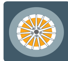
AŽ 19" disky kolies z ľahkej zliatiny