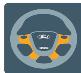
Riadenie s progresívnym účinkom