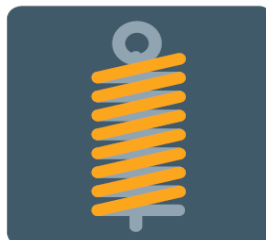
Športový podvozok ST